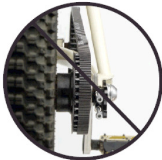
Abbildung 4: falsche Riemenlinie