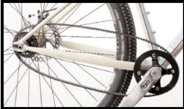
Abbildung 1: Ausgangsstellung vor dem Spannen des Riemen